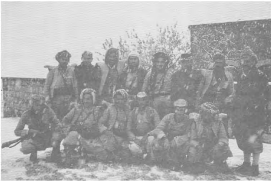
کومه‌تیک سه‌رکرده‌ی شورش و چهند بنشمه‌گه‌یه‌ک، زستانی ۱۹۶۳